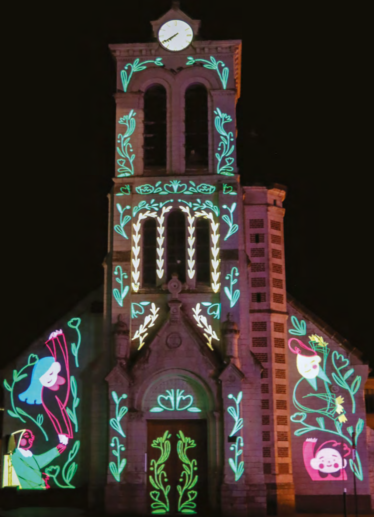
Vidéo Mapping Festival #4 Église Saint-Martin - Vendredi 5 novembre 2021