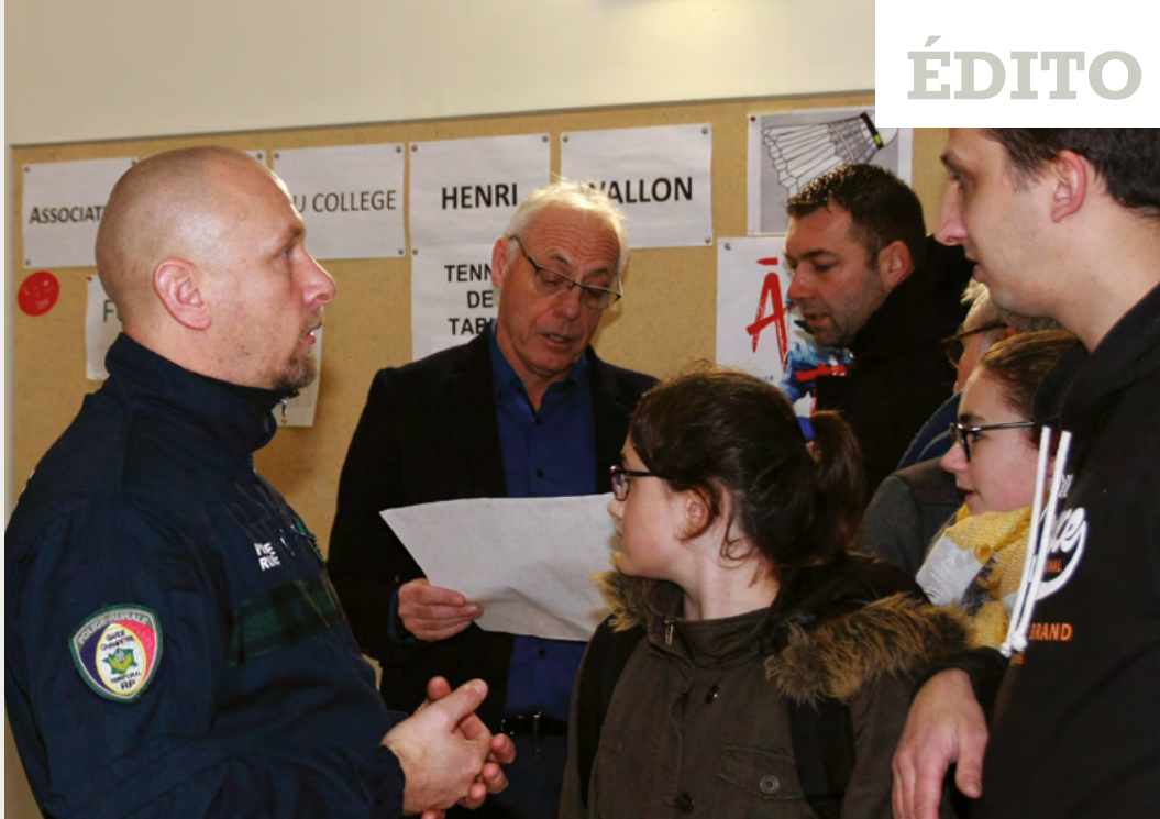
Le maire et la police rurale sont intervenus au collège afin de sensibiliser les parents à ne plus se garer devant l'établissement