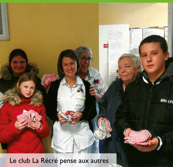
Le club La Récré pense aux autres