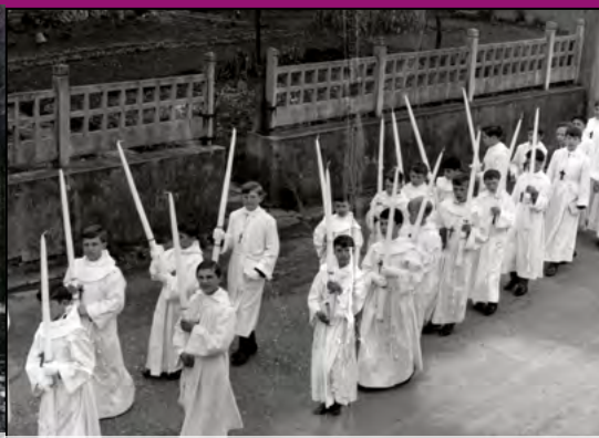
Procession à la période des communions