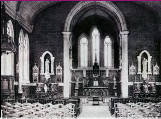
Le coeur du bâtiment était spacieux et bien éclairé