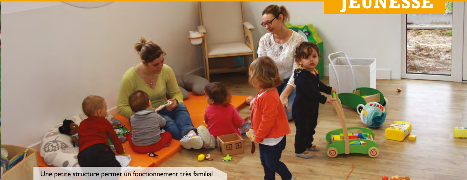
Une petite structure permet un fonctionnement très familial