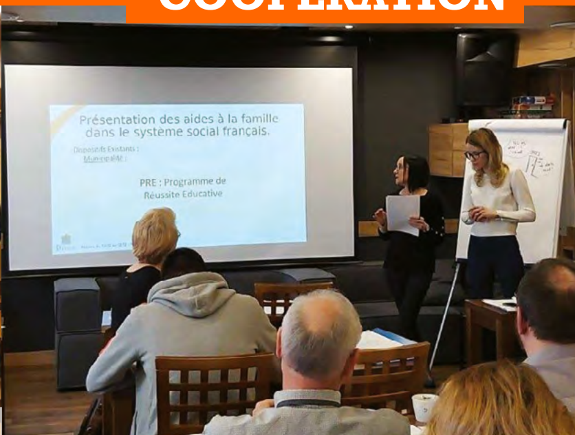
Des professionnels de l'enfance et de la famille composent le groupe de travail