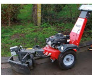
La brosse de désherbage