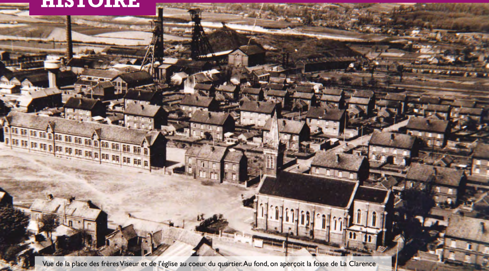
Vue de la place des frères Viseur et de l'église au coeur du quartier. Au fond, on aperçoit la fosse de La Clarence