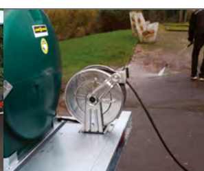
La citerne avec nettoyeur