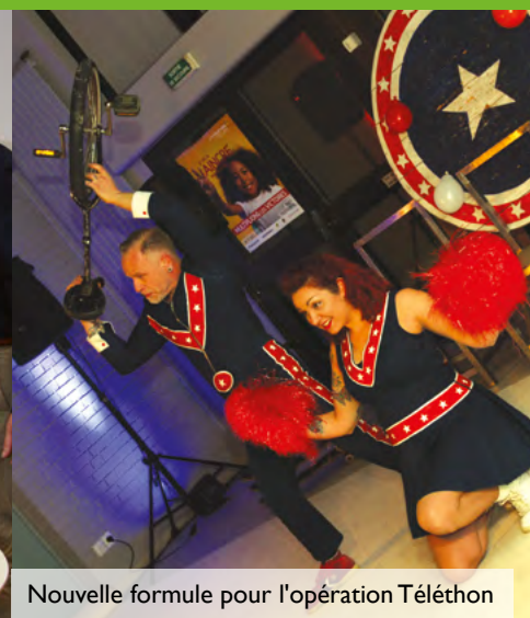
Nouvelle formule pour l'opération Téléthon