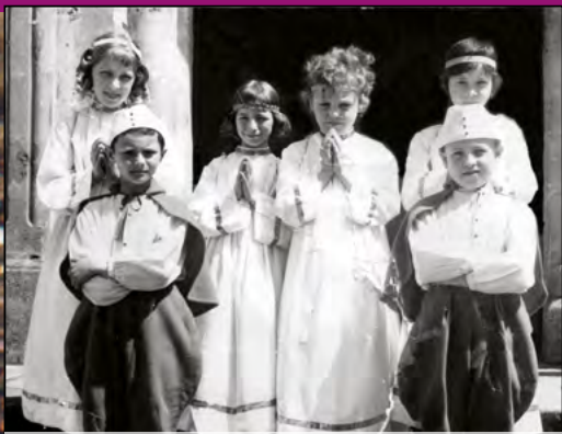
Animation avec le catéchisme