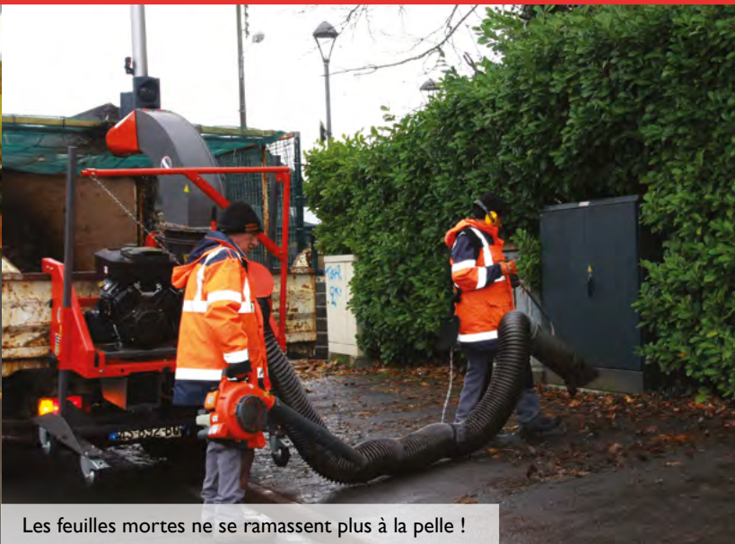
Les feuilles mortes ne se ramassent plus à la pelle !