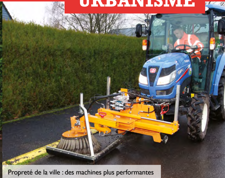
Propreté de la ville : des machines plus performantes