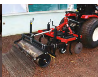
La herse de désherbage